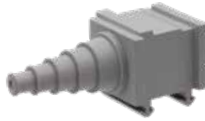
SPP PG T