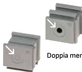
Doppia membrana parallela