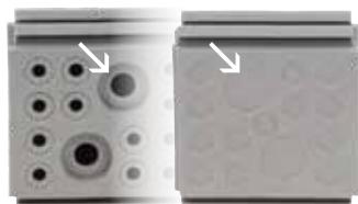
Doppia membrana parallela