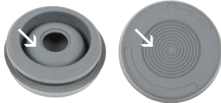
Double membrane parallèle